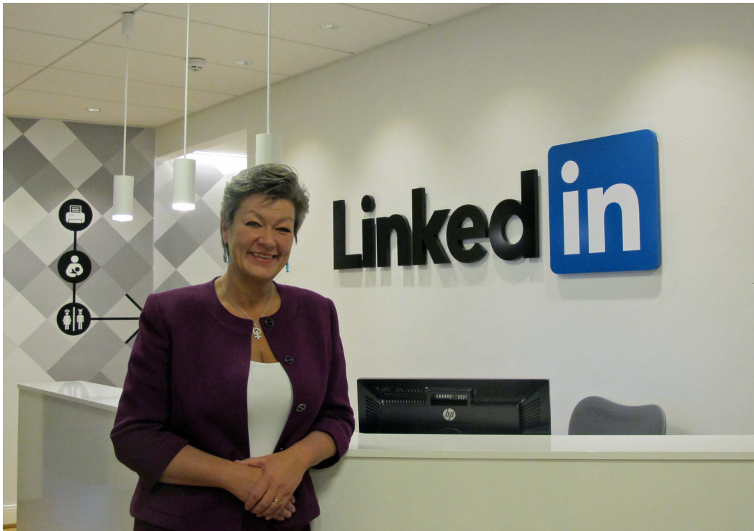
Ylva Johansson, Sveriges arbetsmarknadsminister, har besøkt LinkedIn.